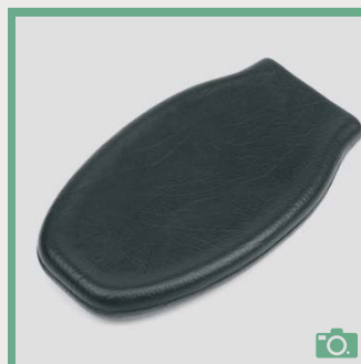
ME 74/75 Appui-main plat