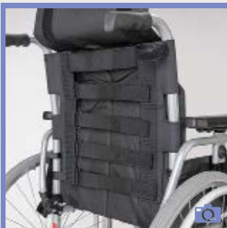
MD 19 Toile de dossier réglable en tension, 5 bandes