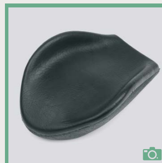
ME 76/77 Appui-main courbe