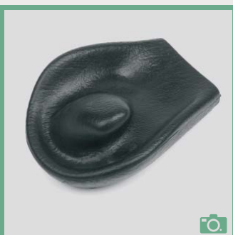
ME 78/79 Appui-main à corne courbe