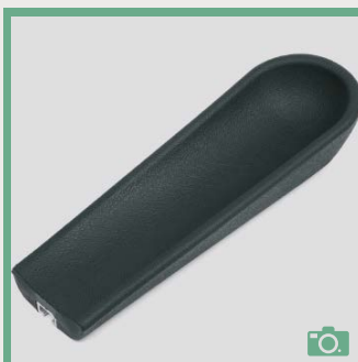
ME 72/73 Coudière longueur 35,5cm