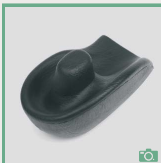
ME 80/81 Appui-main à corne courbe