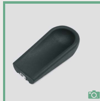
ME 72/73 Coudière longueur 20,5cm