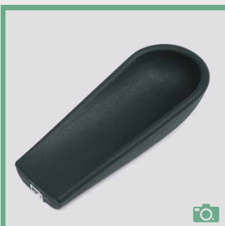
ME 72/73 Coudière longueur 29cm