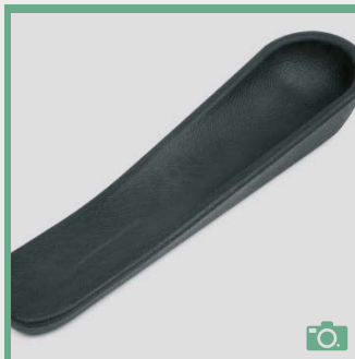
ME 70/71 Gouttière d'une pièce, longueur 46cm