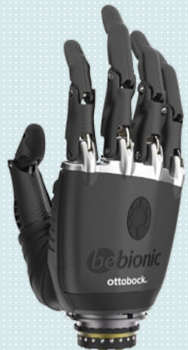
► Taille M noire