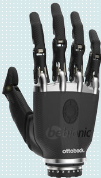
► Taille S noire