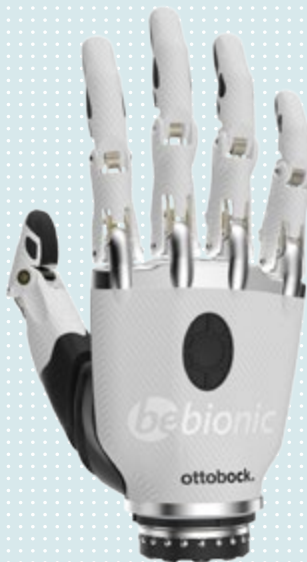
► Taille S blanche