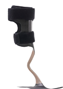
WalkOn Reaction Plus 28U25