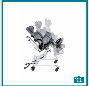
Réglage de l'inclinaison du châssis