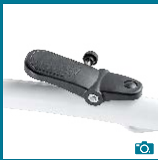
Pédale au pied pour réglage de la hauteur du châssis