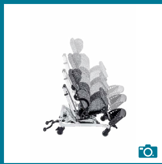
Réglage de la hauteur du châssis