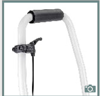
Barre de poussée avec poignée de réglage de l'inclinaison du châssis