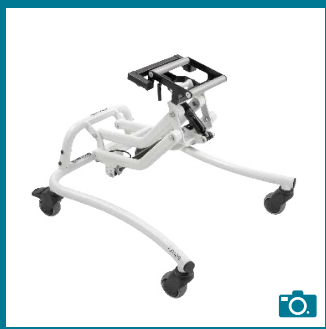
Équipement de série