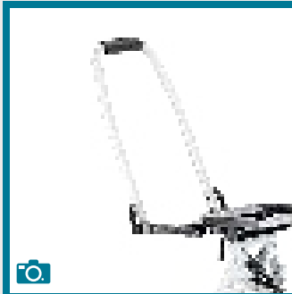
Barre de poussée ajustable en angle