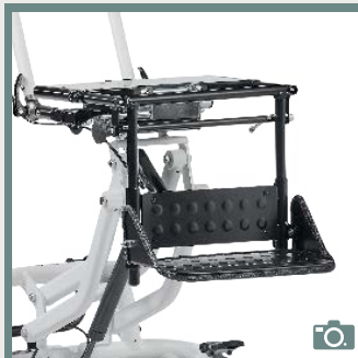
HR32692700-000 Repose-pieds pour interface d'assise