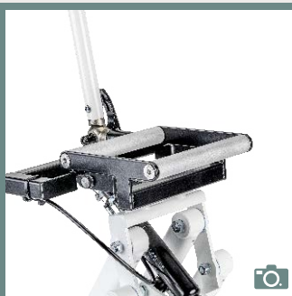
HR32582700-000 Interface d'assise pour corset siège