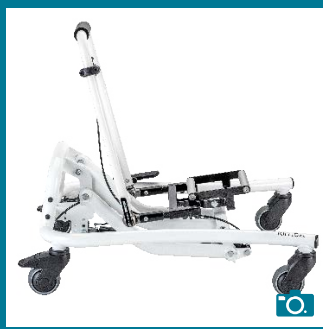
Pliable pour faciliter le transport et le rangement