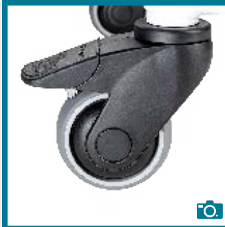
Roue avec freins